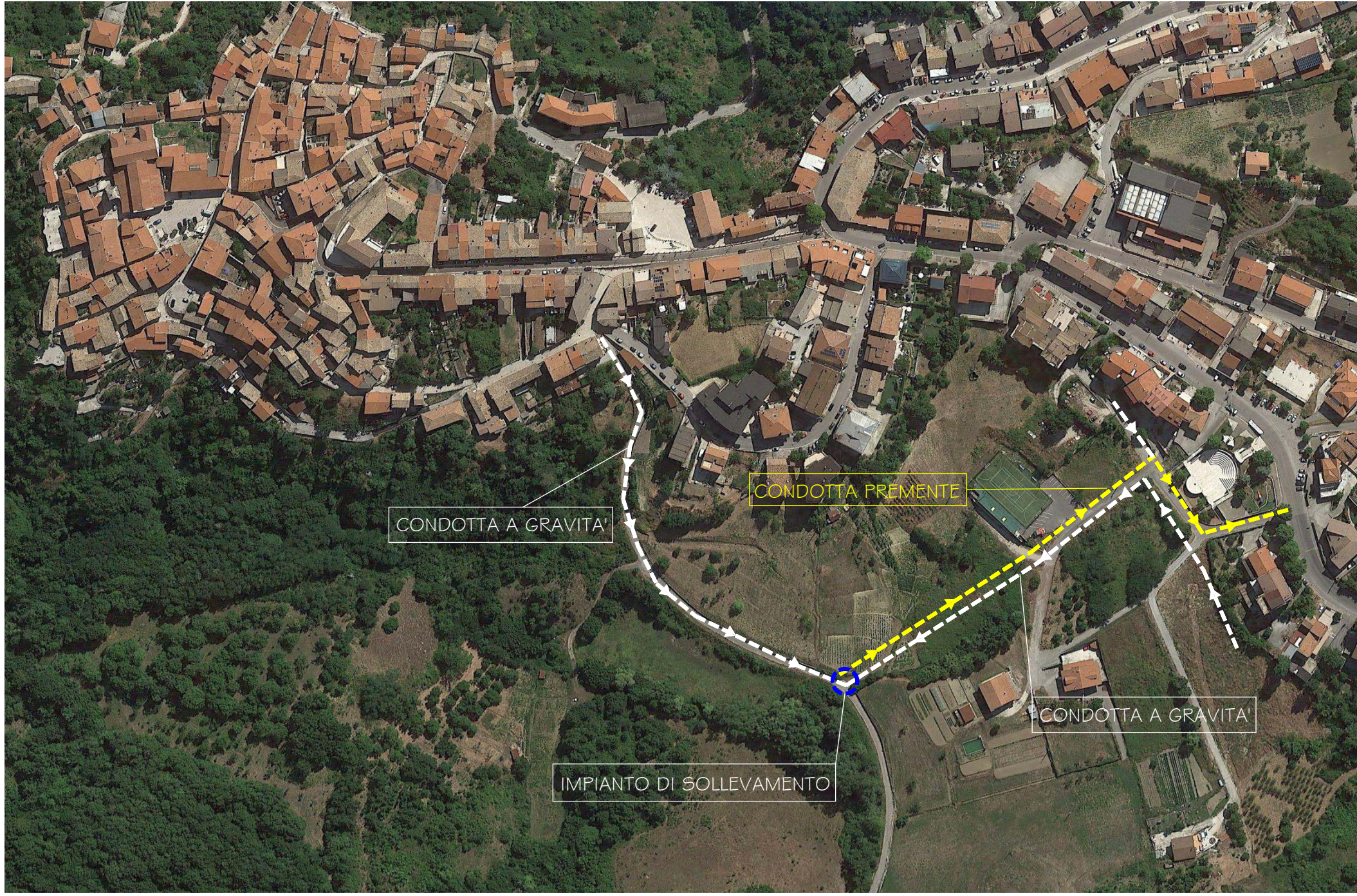
ORTOFOTO CON UBICAZIONE INTERVENTO

REGIONE : CAMPANIA PROVINCIA : AVELLINO COMUNE : MONTEMARANO